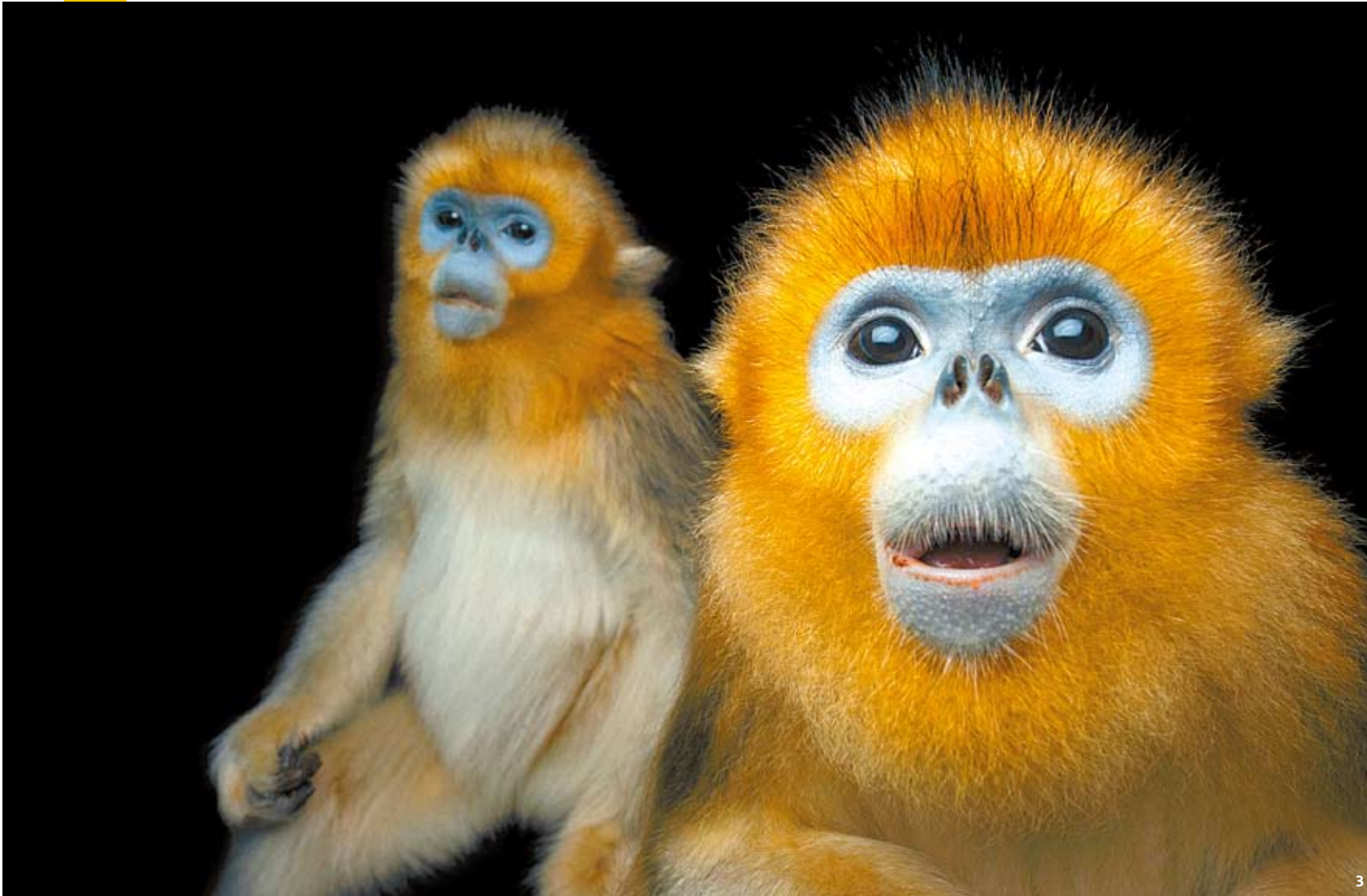
1 북부 사자 입술 코볼소 2 플로리다 퓨마 3 황금 들창코원숭이 4 자이언트 판다 5 울보카푸친 6 말레이 호랑이