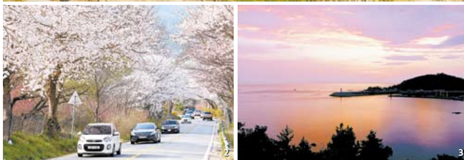
1 Oryuk Island Sunrise Park, North Gyeongsang. 2 The nation's longest cherry blossom road along Lake Daecheong, North Chungcheong, is a 26.6 kilometer (16.5 mile) course. 3 Korea's famous port called Jangho, Gangwon, is also known as the "Napoli of Korea."

The festival boasts an impressive view of canola flowers, cherry blossoms and the blue sea of the East Coast. In downtown Samcheok, there is a famous port called Jangho which is known as the "Napoli of Korea." Here, you can take the Samcheok marine cable car to enjoy the view from above.