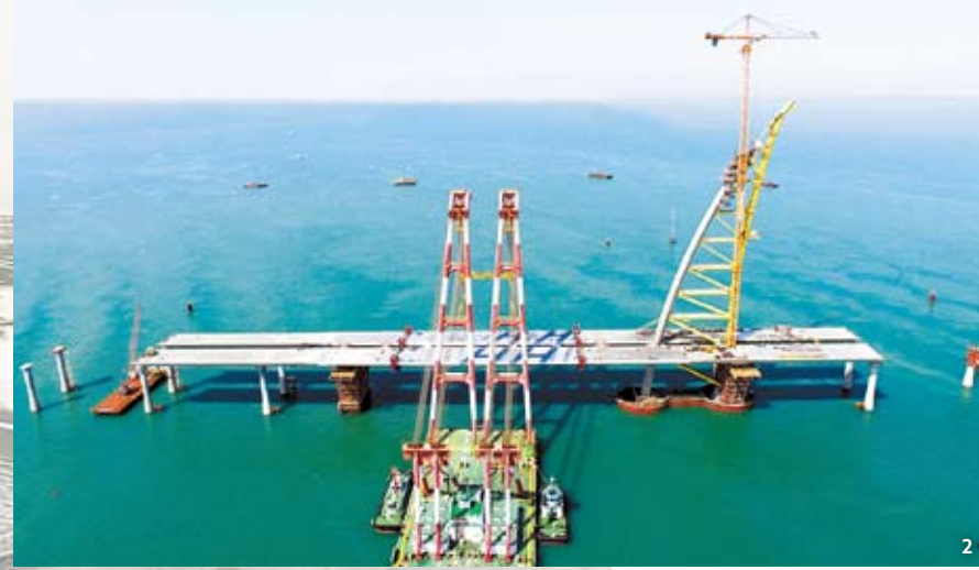
쿠웨이트 셰이크 자베르 코즈웨이 공사 현장 아라비아 반도 동북단에 위치한 열사의 땅 쿠웨이트. 과거 중동지역 해상 교역의 중심지로 불린 이곳에 우리 회사가 시공 중인 셰이크 자베르 코즈웨이 공사 현장이 있다. 쿠웨이트 선왕의 이름을 땀을 정도로 중요한 국책 사업인 이 프로젝트는 쿠웨이트 정부와 국민의 관심을 한 몸에 받으며 우리 회사의 위용을 드러내고 있다. 글=박현희

Hyundai E&C has managed the construction schedule for this mega-size project in a thorough manner. It developed a server system in which a drone is used to frequently check the overall state of work and share relevant information among workers. The introduction of the state-of-the-art network system enabled the construction site to proactively manage risks. As a result, the project has been 4.5 percent ahead of schedule since the construction started.