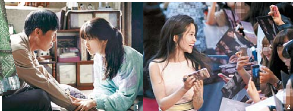
1 <1987>의 한 장면. 2 <아가씨> 레드카펫 행사에 참석한 김태리.