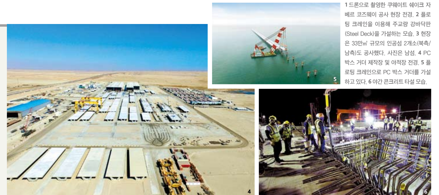
1 드론으로 촬영한 쿠웨이트 셰이크 자베르 코즈웨이 공사 현장 전경. 2 플로팅 크레인을 이용해 주교량 강바닥판(Steel Deck)을 가설하는 모습. 3 현장은 33만㎡ 규모의 인공섬 2개소(북측/남측)도 공사했다. 사진은 남섬. 4 PC 박스 거더 제작장 및 아적장 전경. 5 플로팅 크레인으로 PC 박스 거더를 가설하고 있다. 6 야간 콘크리트 타설 모습.

"직영 공사라는 많은 자재 하나, 외국인 근로자 한 명까지 우리 회사 직원들이 직접 챙긴다는 것을 뜻합니다. 많이 피곤했지만, '세계 최초'라는 타이틀에 누가 되지 않도록 힘을 더 냈던 것 같습니다. 11월 준공을 앞두고 있는 만큼 마지막까지 열심을 다하겠습니다. 감사합니다!"