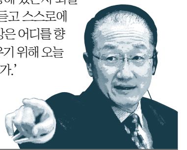
김용 (Jim Yong Kim)

열정의 방향에 정답은 없다. 사람의 생김새가 제각기 다르듯 열정과 꿈을 찾아가는 방법도 다를 수밖에 없다. 그러나 세상 모든 이들이 더 나은 삶으로 발돋움할 수 있도록 기회의 평등을 보장하며 빈곤과 투쟁하는 김용 총재의 열정은 우리 스스로의 열정이 어디로 향해 있는지 되돌아보게 한다. 그의 강연을 듣고 스스로에게 질문해보자. '당신의 열망은 어디를 향해 있는가, 그 열망을 꽃피우기 위해 오늘 의 당신은 무엇을 하고 있는가.'