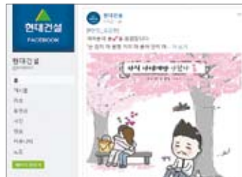
페이스북 한 컷 공감툰.

를 일반인들도 손쉽게 접근할 수 있는 채널을 새롭게 오픈했다"며 "향후 기업의 인지도·선호도 향상에 도움이 될 것으로 기대한다"고 말했다. 한편 우리 회사는 외국인 직원 및 글로벌 고객들을 위한 영문 현대건설 페이스북(www.facebook.com/HDECGlobal)'도 운영 중이다.