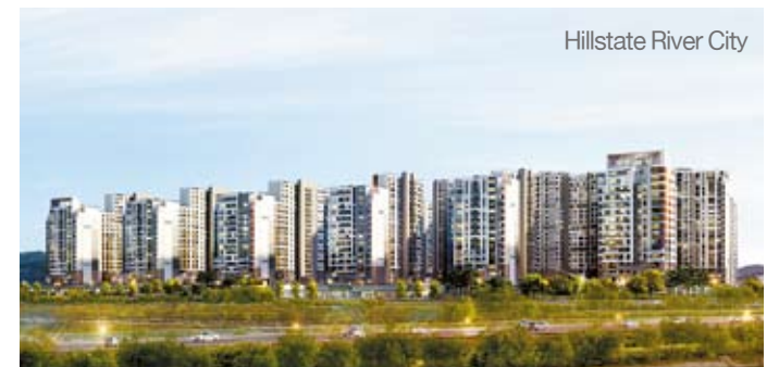
Hillstate River City

cess of the Hillstate River City project ranging from site purchase to construction, Hyundai E&C has fully mobilized its capabilities. It strengthened safety by using the anti-seismic steel brand developed by Hyundai Steel, and adopted facilities specializing in cutting down on fine dust. In addition, Hyundai E&C will presale Sejong Master Hills located in Sejong Metropolitan Autonomous City. The apartment complex consists of 66 buildings of up to 25 floors above ground and 2 basement levels with 3,100 units.