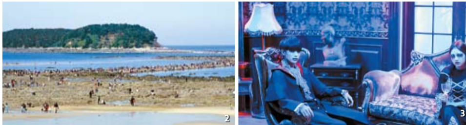
1 Tourists ride on a sky rope at the Fantastic Waterland Hwacheon Jjokebae Festival, 2 The Muchangpo Mystic Sea Road Festival will be held from Aug. 3 to 5, 3 "Ghost Park," a haunted village featuring staff members dressed up as spooky characters at night.

courageous challengers until Aug. 19. Admission is 25,000 won for adults.