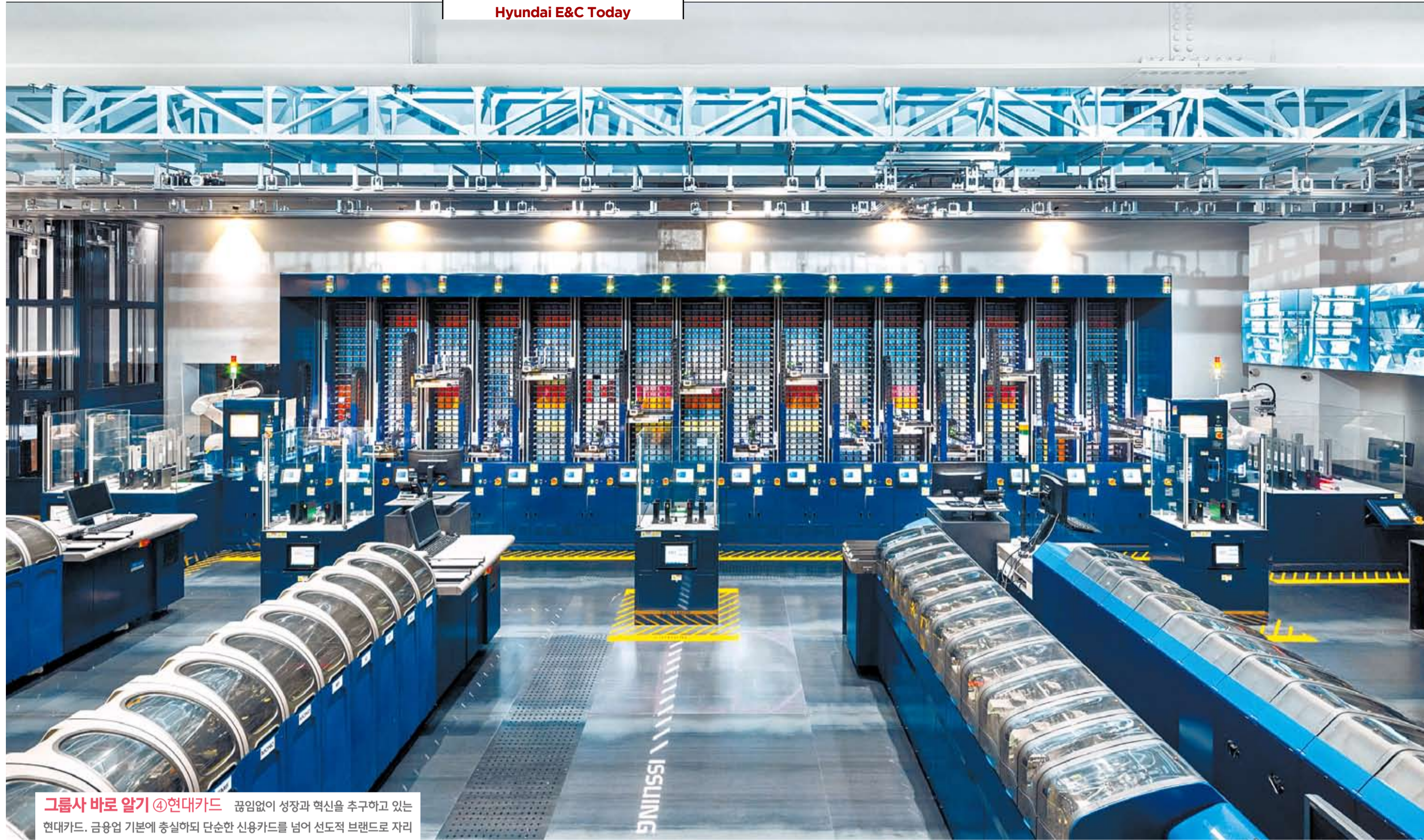
그룹사 바로 알기 @현대카드 끊임없이 성장과 혁신을 추구하고 있는 현대카드. 금융업 기본에 충실하되 단순한 신용카드를 넘어 선도적 브랜드로 자리 잡은 현대자동차그룹의 대표적인 금융사에 대해 알아보자. 글·사진=현대카드 홍보팀 한나리 대리