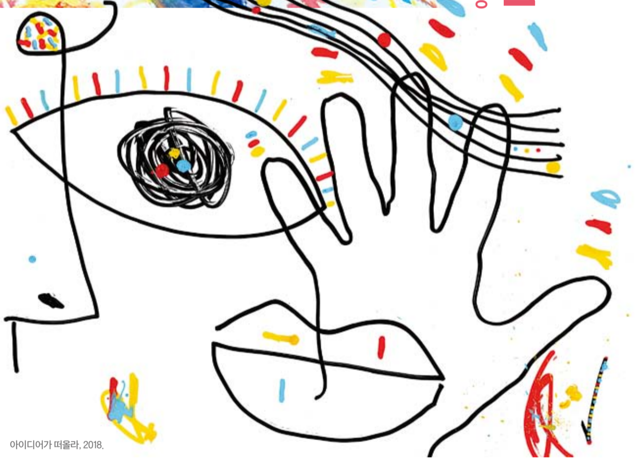
아이디어가 떠올라, 2018.

에르베 툴레는 고정된 방식으로 그리는 그림, 예쁜 그림, 잘 그린 그림이 정답이라고 말하지 않는다. 다만 내면에 존재하는 예술적 감성을 스스로 발현하고 일상의 아름다움을 자유롭게 표현하도록 돕는다. 이번 전시에서도 관람객들의 역할은 단지 눈으로 보기만 하는 데 그치지 않는다. 보고 듣고 만지는 등 오감으로 에르베 툴레 작품을 느낄 수 있으며, 전시와 더불어 다양한 예술 체험의 기회도 제공한다. 이번만 아니라 영국 런던의 테이트 모던과 미국 뉴욕의 MoMA, 구겐하임 미술관에서 선풍적인 인기를 끈 아트 워크숍도 함께 열린다. 관람객이 직접 참여해 함께 완성한 참여 예술 작품도 함께 선보인다. 무더운 여름, 가족이 함께 전시장을 찾아 자유로움을 만끽하고 예술적 감성을 일깨워 보면 어떨까.