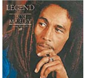
LEGEND BOB MARLEY

라틴 음악에서 안데스 음악을 빼뜨리면 바보 소리를 듣는다. 안데스 음악은 라틴 아메리카 음악의 기둥이자 DNA로 들는 순간 명확하게 구분되는 특징이 있어 ‘바람의 음악이자 노을의 서정미를 담고 있는 음악’이라고 평한다. 20세기에 안데스 음악을 세계적으로 알려지게 한 폴 사이먼(Paul Simon)의 ‘엘 콘도르 파사(El condor pasa)’가 대표적이다.