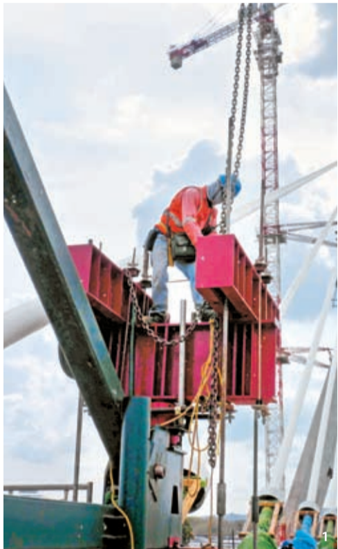
1 사장교 배합 후 기준에 설치된 이동식 거푸집(Form Traveller)을 제거하기 위해 앵커(Anchor)를 해제하고 있다. 2, 4 강철을 꼬아 만든 스트랜드를 모노 잭으로 긴장하는 방식인 MS 공법으로 케이블을 설치하고 장력을 조절하는 모습. 3 절속도로 공사를 위해 노상 작업을 하고 있다.