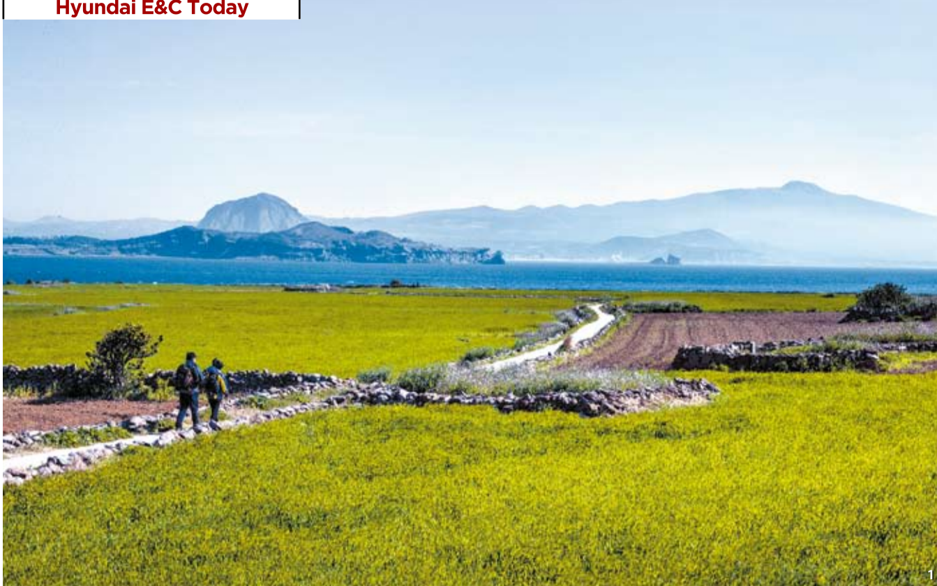
1 가파도에서 바라본 제주도 남쪽, 2 가파도 하우스 외부(신경섭 작가).

해가 좋은 날 제주도 모슬포 운진항에서 바라보면 바다 멀리 작은 섬 하나가 아스라이 보인다. 가파도. 가오리(가파리)를 닮아서 가파(갯개)를 닮은 것에서 유래했다고 하는데, 독특한 발음 덕인지 아니면 바다에 딱 달라붙은 나지막한 지평선의 풍경 때문인지 한번 보면 기억 속에 오래 남는다. 섬 둘레는 약 4km. 걸어서 한 시간. 섬의 풍광을 즐기며 천천히 걸어도 두 시간이면 출발지에 닿는다. 주민은 채 200명이 안 된다. 여러 가지로 작은 섬이다. 봄이 오면 청보리 축제를 찾아온 육지 사람들로 한 동안 분주해지지만 얼마 후 계절이 바뀌면 사람들은 썰물처럼 빠져나가고 섬은 침묵에 잠긴다. 그야말로 평범하다면 평범한 작은 섬이다.