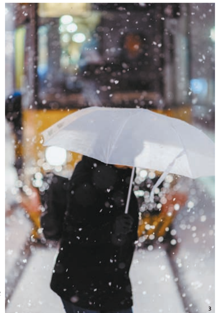
1 Cloud Way, Street Errands, 2017 2 Nimbus Roebourne, Pilbara, WA, 2017 3 The Blizzard, 2017 4 St. Monica's Church, 19th Ward After The Fire, 2012