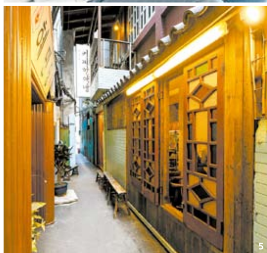
1 회원제로 운영하는 ‘취향관’에 모여 담소를 나누는 사람들. 자신만의 시간을 즐기거나 타인과 교류할 수 있는 공간이다. 2 최근 편안함을 주는 식물을 활용한 인테리어가 인기를 끌고 있다. 3 술을 마시며 책도 읽을 수 있는 ‘책방’. 4 쉽고 짧게 액티비티를 즐기며 기분 전환할 수 있는 VR룸 또는 카페도 케렌시아가 될 수 있다. 5 나만 아는 아지트 같은 공간, 도시의 골목길도 핫플레이스로 떠오르고 있다.

슈가 맞물리며 플랜테리어와 홈 가드닝의 영역은 점점 커지고 있다. 집에 있는 시간이 적을 수 밖에 없는 직장인에게는 자신만의 공간인 사무실 책상이 케렌시아가 되기도 한다. 이른바 ‘데스크테리어’다. 사막 같은 직장생활에서 ‘오피스템’을 활용해 내 자리만이라도 오아시스로 만들고자 노력한다.