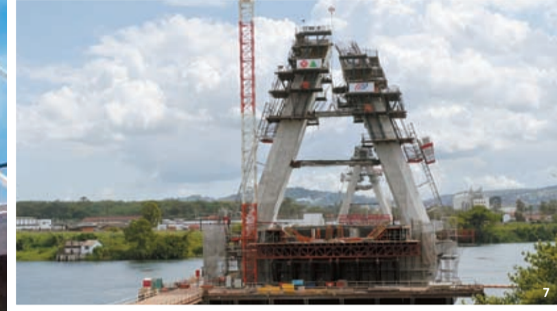
5 오는 10월 말 개통 예정인 우간다 진자교량 전경. 6 지난 3월 드론으로 촬영한 사장교가 폐합되기 전의 모습. 7 콘크리트 구조물인 주탑에는 자동상승 발판 거푸집 공법을 적용했다.

아프리카 최초로 시도되는 사장교 공사라 우간다 정부와 주변국까지 그 이목이 집중됐다. 케이블 시공에는 MS(Multi Strand) 공법을 이용했다. MS 공법이란 강철을 꼬아 만든 스트랜드(Strand)를 모노 잭(Mono SJack)으로 단단히 당기는 것으로 케이블 장력을 높인다. 높이 82.2m에 이르는 콘크리트 구조물인 주탑에는 자동상승 발판 거푸집(Auto Climbing Form) 공법을 적용했다. 콘크리트를 타설한 후 거푸집을 교체하지 않고 유압장치에 의해 거푸집과 발판이 자동으로 상승하는 방식이다. 이 공법을 사용하면 해상 및 고공 작업의 안전성을 높이고, 공기를 단축시킬 수 있다.